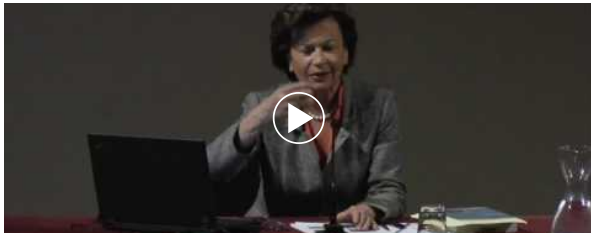
VIDEO DEL GIORNO