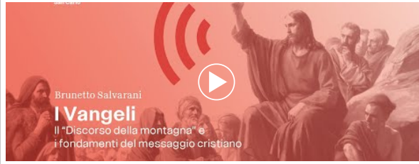
VIDEO DEL GIORNO venerdì 3 dicembre 2021

LABORATORIO DUEMILAVENTISEI martedì 7 febbraio 2023