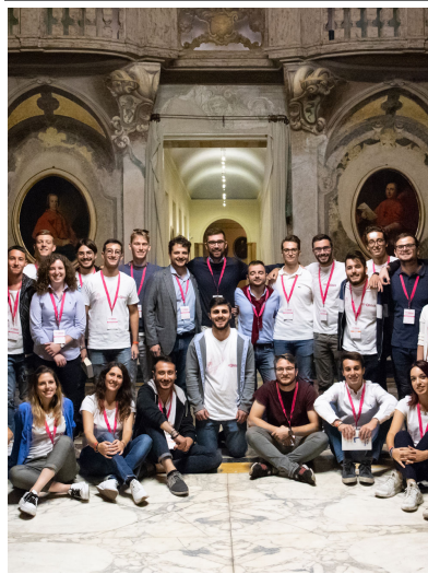
VITA DI COLLEGIO