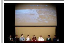
Studenti in cattedra