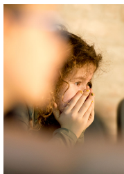
FilosoFare: l'esperienza dei corsisti lunedì 27 ottobre 2014