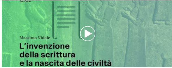
VIDEO DEL GIORNO venerdì 11 novembre 2022