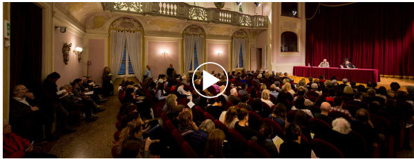
AUDIO DEL GIORNO