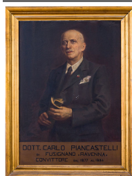
RITRATTO DEL GIORNO