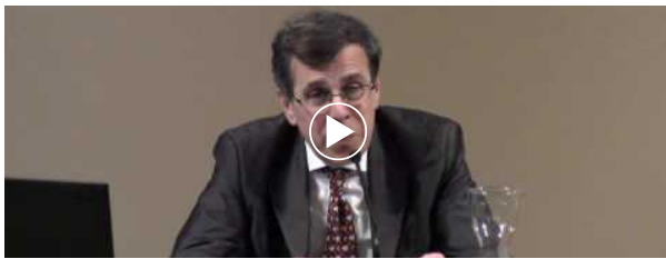
VIDEO DEL GIORNO