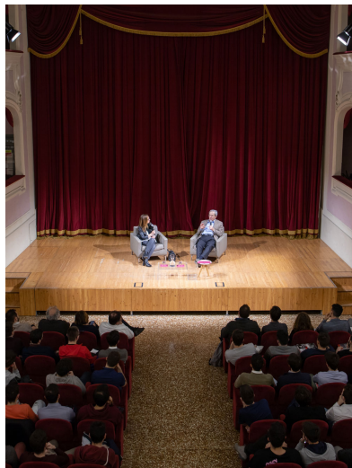
VITA DI COLLEGIO