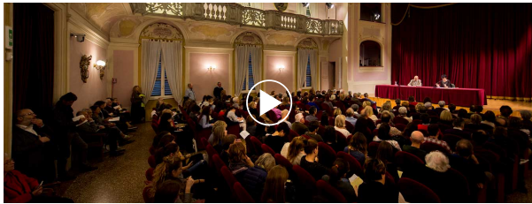
AUDIO DEL GIORNO