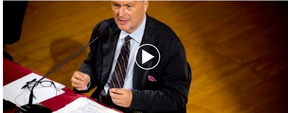
VIDEO DEL GIORNO