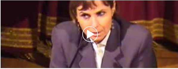
VIDEO DEL GIORNO